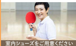
室内シューズをご用意ください