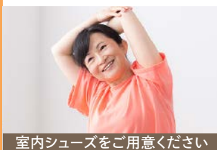
室内シューズをご用意ください